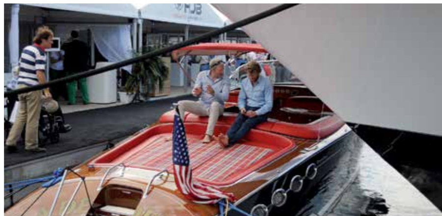
J-Craft hade en udda plats under fören på en jättebåt.

VAKTERNA PÅ BÅTAR i den här storleksklassen har lite av en attityd kan man säga. Bortser man från detta fåtal människor så är mässan otroligt rolig att besöka. Amerikanerna kallas ofta för ytliga, men jag föredrar detta alla dagar på året jämfört med alla "korrekta" svenskar. Här hälsar man glatt på alla i hissen och efter några våningar vet man allt om varandras hemvist och man önskar varandra en trevlig dag innan man går åt varsitt håll. Det är lite skillnad mot oss svenskar som gärna pluggar in samtliga skyltar i hissen utantill, bara för att slippa se att det finns andra i hissen. Kanske borde vi lära av amerikanerna?