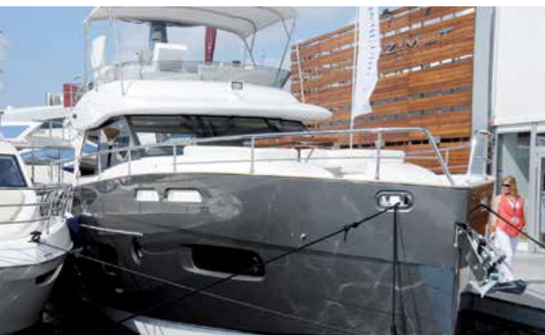
En ny designlinje från Azimut. Denna är av modellen 50 Magellano.