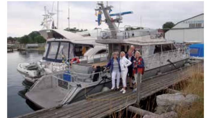
Hamnplatsen i Fårösund.