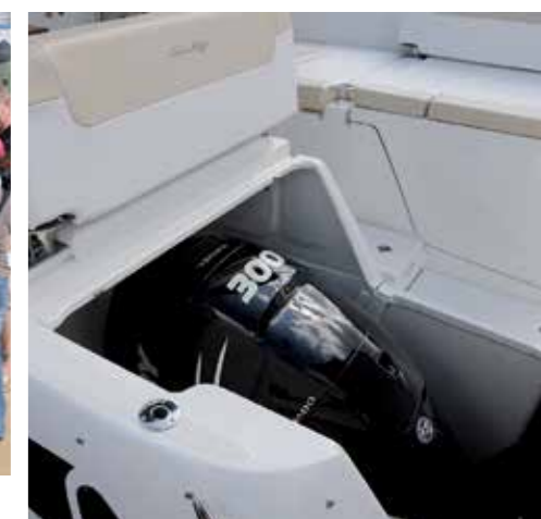
Motorerna sitter under varsin lucka, en på vardera sidan om gången från badbryggan.