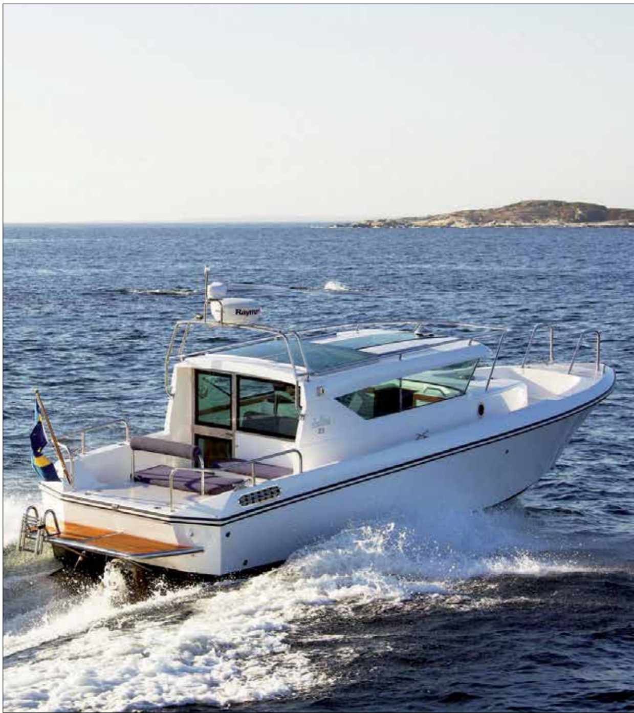
DELTA 29 SIDEWALK, ETT RENT NÖJE FRÅN A TILL ÖN