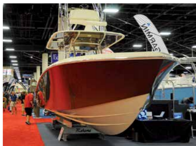
Att amerikanska båtar inte skulle hålla god kvalitet motsägs av bland annat finishen på denna skrovsida.