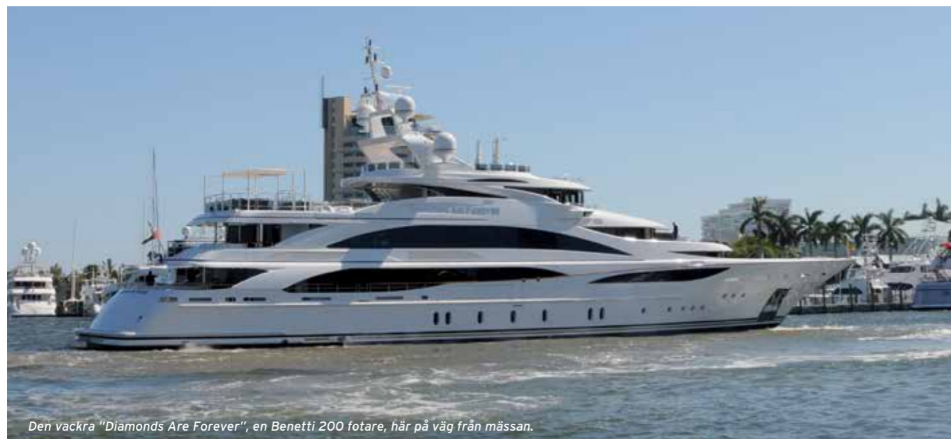
Den vackra "Diamonds Are Forever", en Benetti 200 fotare, här på väg från mässan.