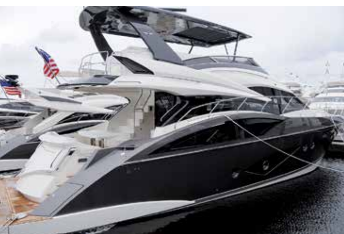
Marquis 630 SQ, en otroligt fin båt med egna linjer i designen. Ännu en av de nya kvalitetsbåtarna som byggs i Amerika.

ROLIGT VAR DOCK att se några svenska båtar utställda. Liksom förra året var