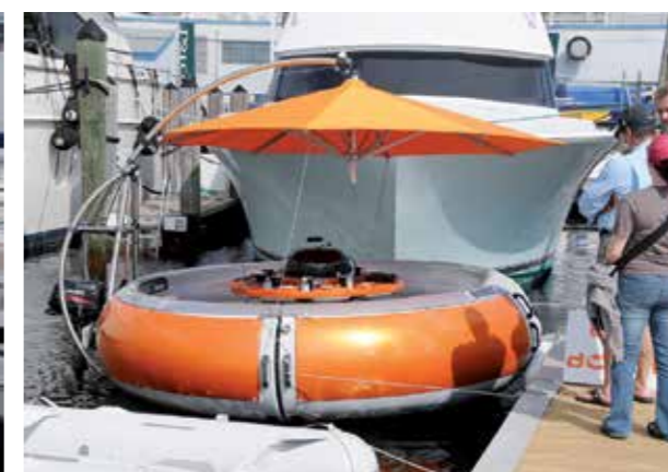
Detta är en "BBQ Donut" som helt enkelt är en rund båt med en grill i mitten. Båten är godkänd för upp till 10 personer och motor på upp till 25 hk. Typiskt amerikanskt säger säkert många men båten görs i Tyskland.