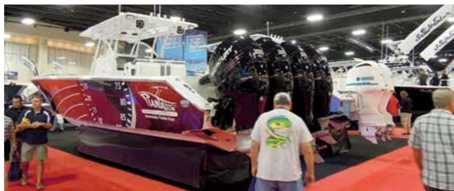
1400 hk på en medelstor båt!

J-Craft här med en båt. I år hade man dock fått en konstig plats under fören på en jättebåt. Många beundrande blickar och uppskattande kommentarer blev det i alla fall. Även Delta var här, för första gången. Man visade en 26-footare och sin fina Delta 54. Detta var första gången jag haft tillfälle att titta närmare på denna båt och jag är mycket imponerad. Detaljlösningarna är med några undantag mycket genomtänkta och byggkvaliteten är absolut i topp. Det känns roligt att kunna säga att en av de absolut finaste båtarna på mässan var svensk.