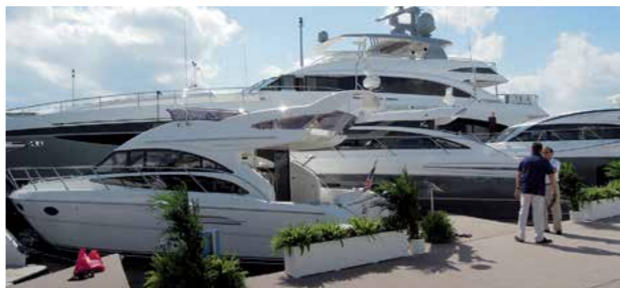
Princess 40M var en imponerande skapelse. Man förstår hur stor hon är när man jämför med de vanliga Princesserna som ligger bredvid.

MÄSSANS VACKRASTE BÅT var nog "Diamonds Are Forever", en 200-fots Benetti från 2011. Det är inte alltid som designfolket får till det på så här stora båtar men denna är fantastisk. Naturligtvis är prislappen på en sådan båt väl tilltagen men lyckligtvis går den också att hyra veckovis. Då stannar priset på mellan 395 000 och 450 000. Och då pratar vi naturligtvis dollar. Vi gjorde inte ens ett försök att gå ombord denna gång.