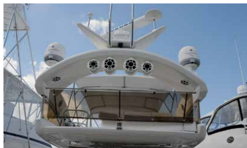
En ny trend är att ha ordentliga högtalare utomhus. Folk åker också omkring i kanalerna och spelar för alla i närheten. Undrar om trenden kommer till Sverige?