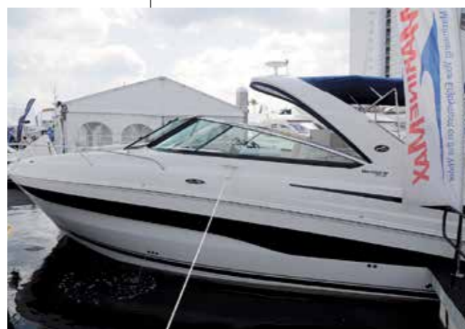
SeaRay 370 Venture är märkets nya modell med inbyggda utombordare.