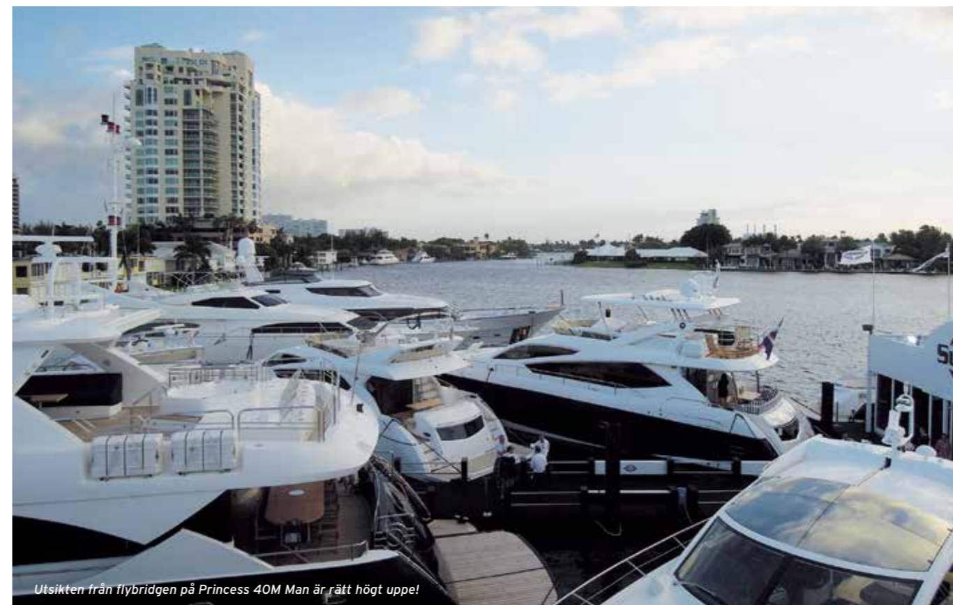
Utsikten från flybridgen på Princess 40M. Man är rätt högt uppe!

EN ANNAN NYHET var från Sea Ray som visade sin Venture 370. Båten är unik för att den har två utombordare "inbyggda" under luckor eller som de själva beskriver det; Hidden Outboards. Detta ger båten enorma innerutrymmen och troligen enklare hantering av