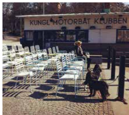
DET PERFEKT CAFÉET ATT PAUSA PÅ I HUNDPROMENADEN.

servering, båtmacken och var hamnkaptan parallellt. Nu när båtmacken har fraktats bort till Grinda ligger huvudfokus på fiket, KMK kafé.