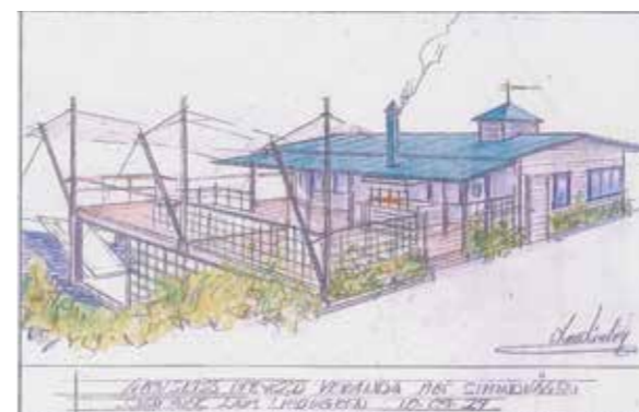
RITNINGAR PÅ UTBYGGNADEN AV KMK'S CAFÉ AV LARS LIEDEGREN.