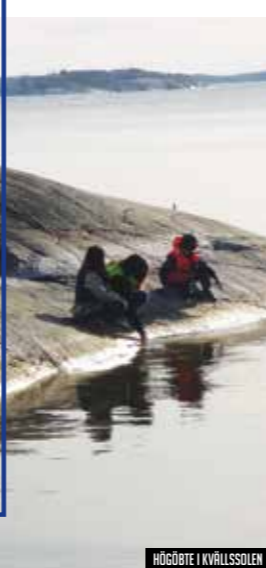
HÖGBÖTE I KVÄLLSSOLEN