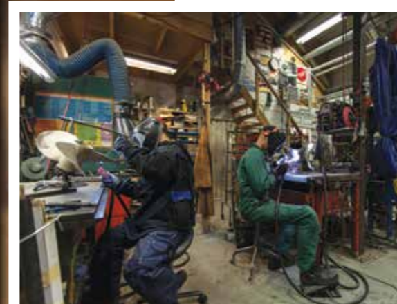
IDOGT ARBETE I VERKSTADEN.