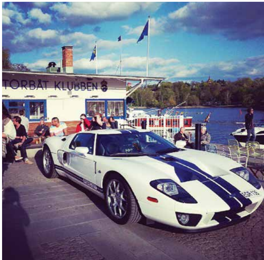
PÅ CAFÉET HÄNGER ALLT FRÅN LATTEMAMMOR TILL BÅTENTUSIASTER OCH AMBASSADÖRER.