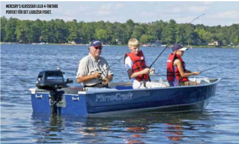
MERCURY'S KLASSISKA LILLA 4-TAKTARE PERFECT FÖR DET LJUDLÖSA FISKET.