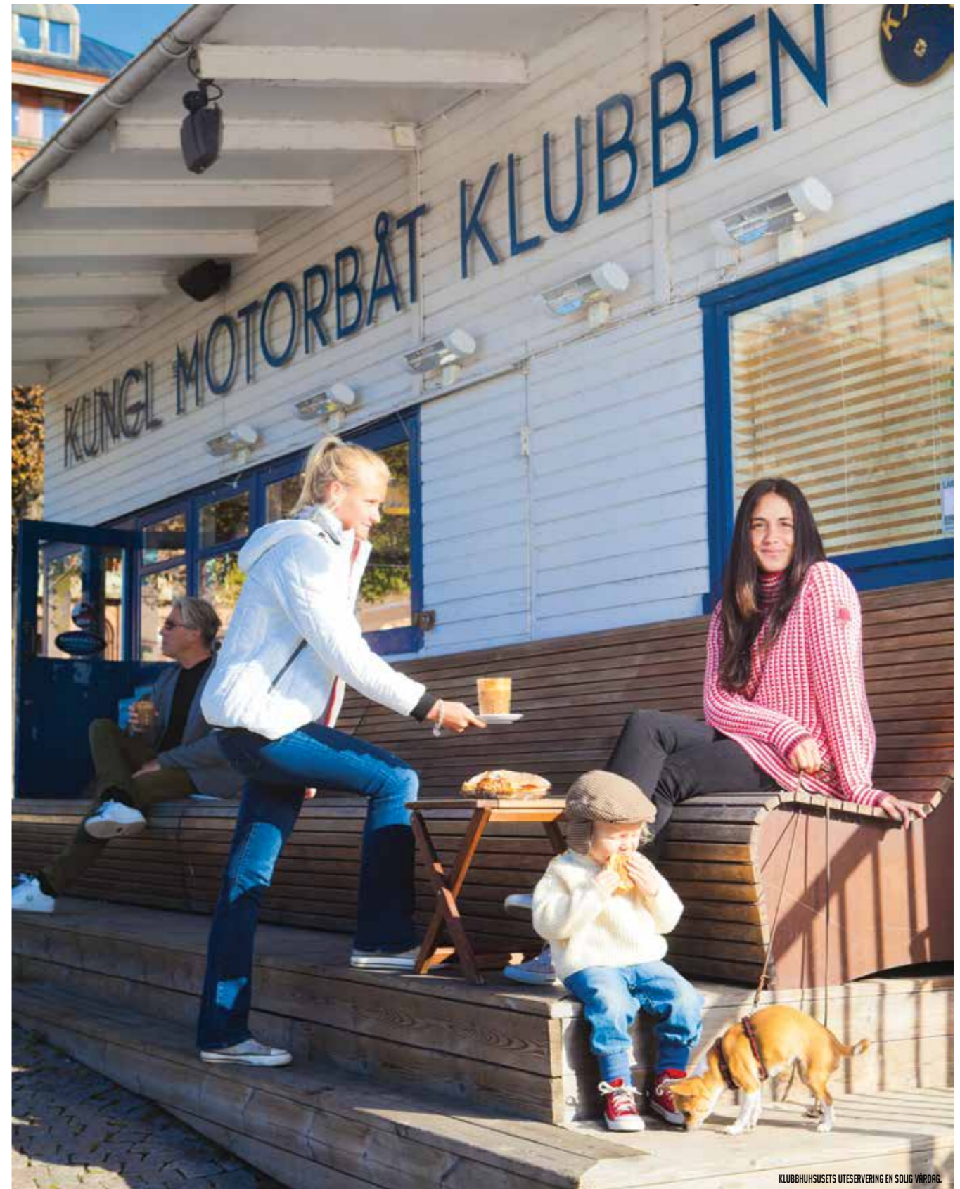
KLUBBHUSETS UTESERVERING EN SOLIG VÄRDARE.

Klubbhuset vid Djurgårdsbron har varit Bertlings oas i 14 år. När han tog över driften var där en övergiven Shellstation, en butik med enkla förnödenheter och en båtmack som gick på sparlåga. Det ryckte han upp betänkligt. Under några år skötte han butik/