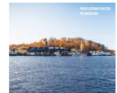
PROPELLERTRIMS VERKSTAD PÅ LÅNGHOLMEN

Efter många år i branschen sitter kunskapen i fingrarna. Tveka därför inte att kontakta oss och fråga om råd – vi hjälper dig att hitta den absolut bästa matchningen mellan båt och propeller. ❖