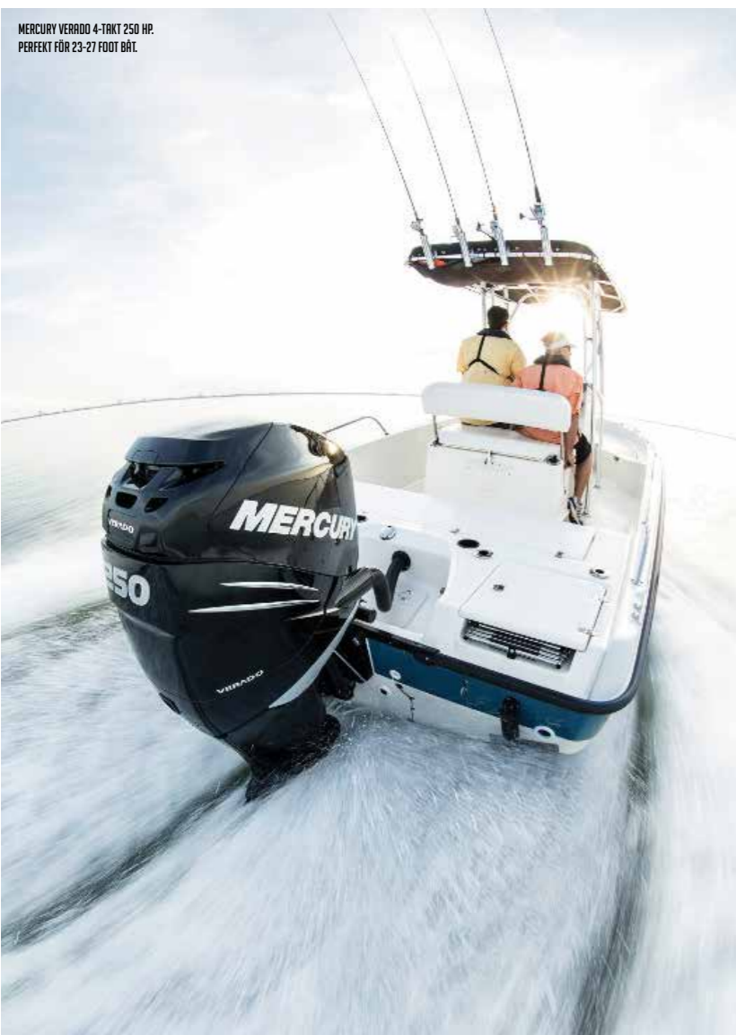
MERCURY VERADO 4-TAKT 250 HP. PERFECT FÖR 23-27 FOOT BÅT.