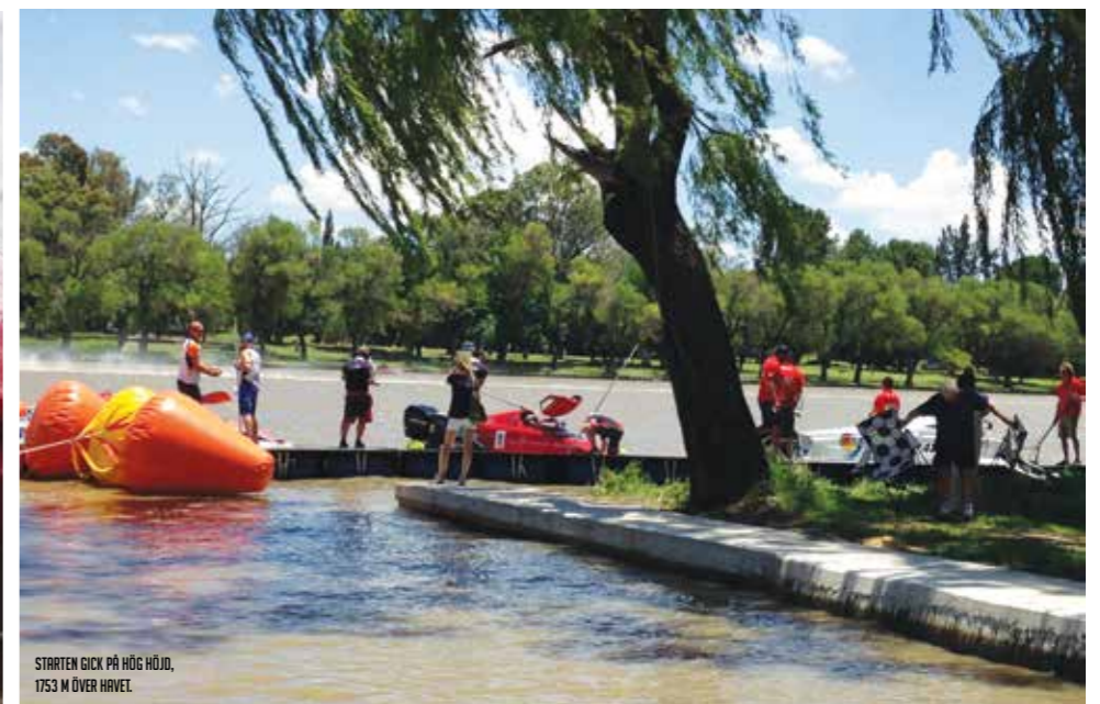
STARTEN GICK PÅ HÖG HÖJD, 1753 M ÖVER HAVET.

När vi väl hade landat på Johannesburgs flygplats blev vi mötta som kungligheter för vidare transport till hotellet och race platsen.