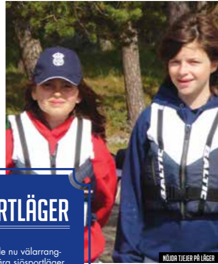
NÖJDA TJEJER PÅ LÄGER