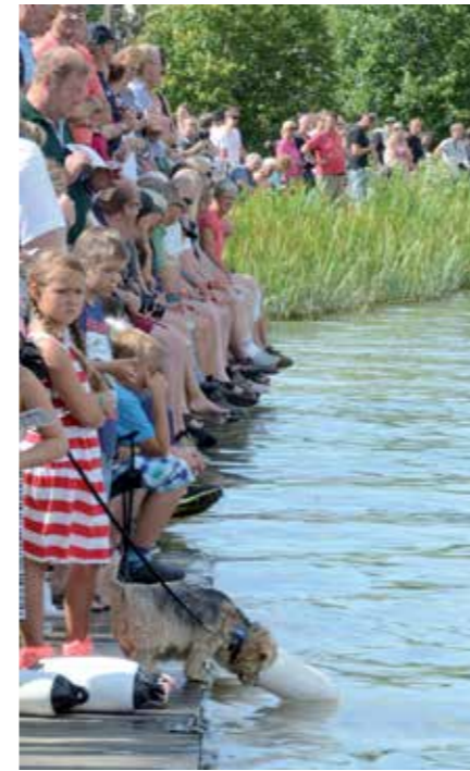
Kanalbanken var välfylld med folk under hela eventet