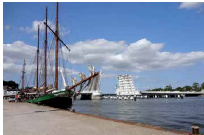
Broöppning i Kappeln