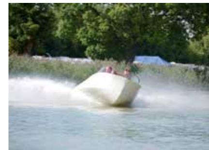
Pelle Källås vackra IW kom direkt från removingen med en rak sexas Mercury på akterspegeln