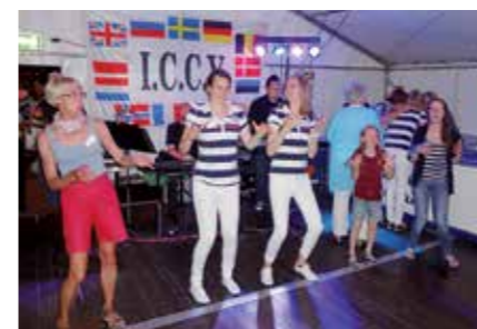
Vi lär oss nya danser