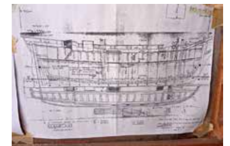
Medeltida enkla ritningar