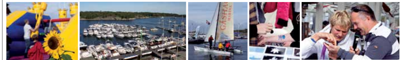
Bilderna är från 2012

Vi har all den service som behövs för konservering, rengöring, täckning genom inplastning m.m. för båtar upp till 80 fot.