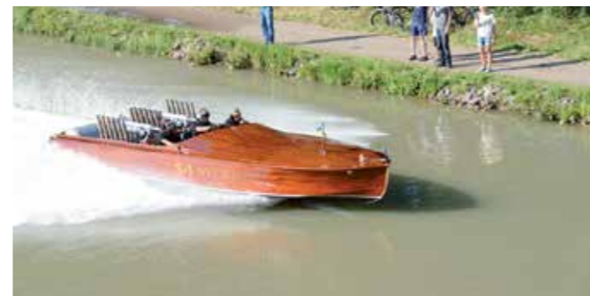
Dånet från Sveriges dubbla Rolls Royce-V12or var öronbedövande vackert