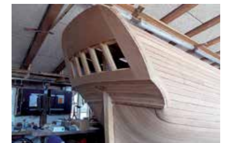
Kopior av ostindienfarare byggs ....

gamla båtar renoveras och nya båtar byggs efter medeltida ritningar.